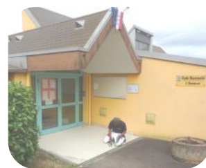
Ecole maternelle Réfection de l'entrée

Divers travaux d'entretien ont été également effectués aux écoles maternelle et élémentaire ainsi qu'au pôle périscolaire « l'arc-en-ciel » avec la réfection du sas d'entrée.